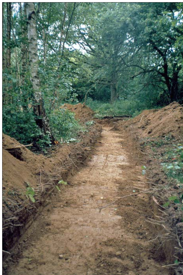
Figur 3. Sökschakt sett från söder.

Vid den arkeologiska utredningen etapp 2 av dammen som var tänkt att placeras på tomtmark intill Vitmangården framkom att inga arkeologiska åtgärder var nödvändiga. Anledningen var att dammen skulle anläggas i en redan befintlig sk branddamm som tillhörde fastigheten. Vid platsen för den andra dammen, norr om de befintliga dammarna, utfördes en sökschaktgrävning. Schakten hade en längd av ca 10-15 m, en bredd av ca 1,6 m och ett djup av 0,35-0,45 m.