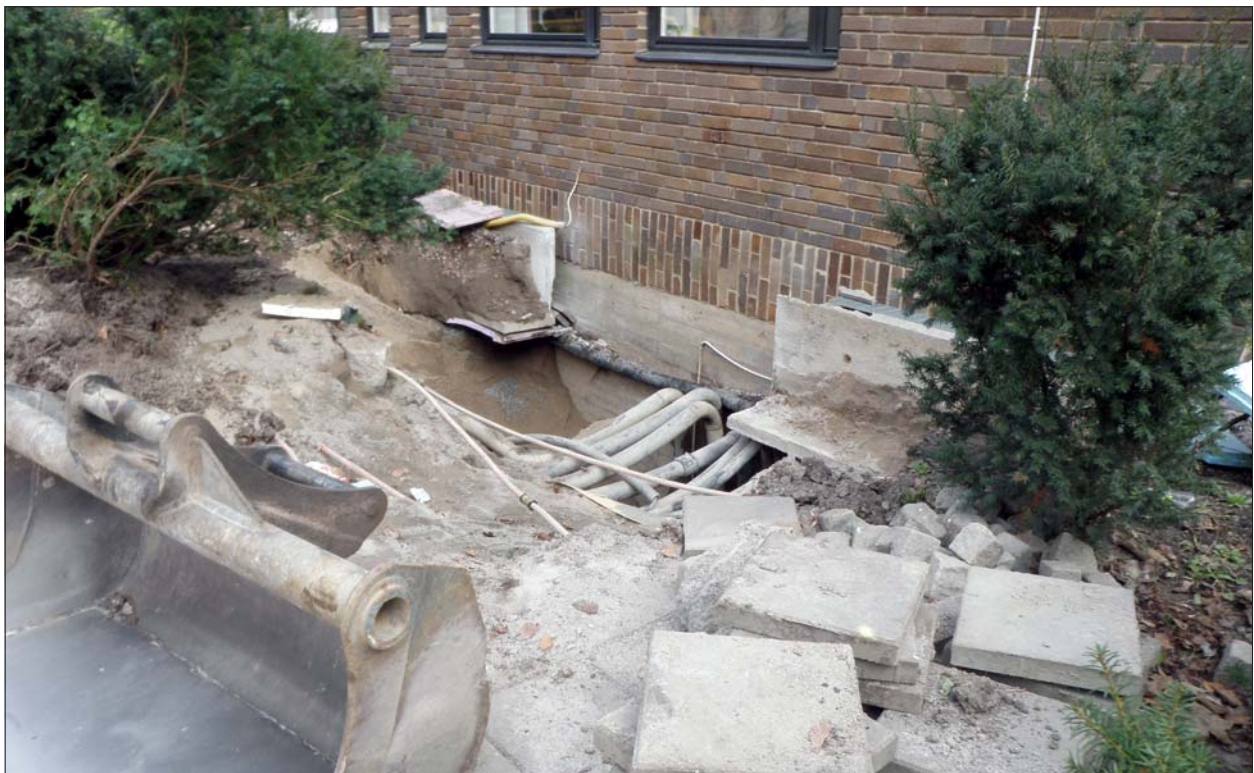
Figur 4. Schaktet under pågående grävning. Inga bevarade kulturlager berördes.

Schaktet upptogs för att söka och reparera en läcka i det befintliga fjärrvärmenätet. Inga lager som inte tidigare grävts upp kom att beröras och schaktet innehöll endast fjärrvärmeinstallationer och fyllnadsmassor. Ingen annan dokumentation är fotografering av det pågående arbetet ansågs därför nödvändig.