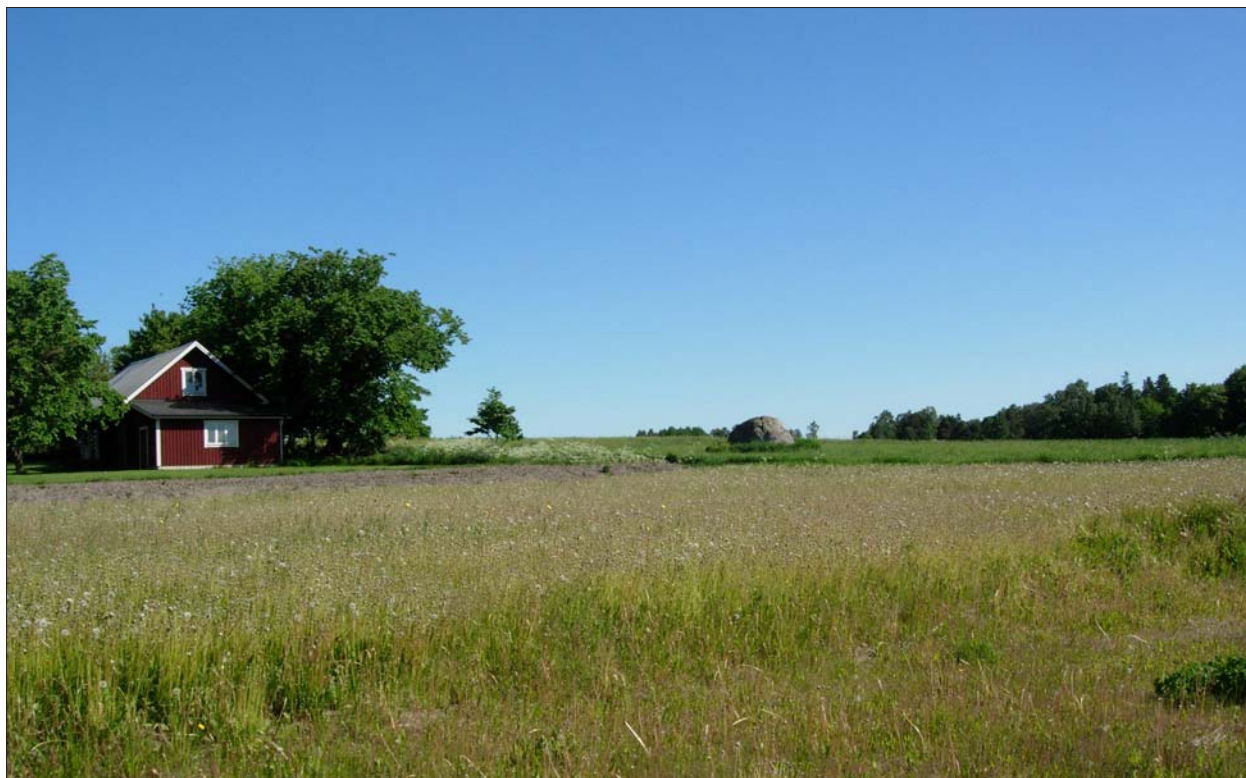
Figur 3. Översiktsbild mot nordost från utredningsområdet. Stenblocket med skålgropar (RAÄ 231) i centrum.

Inget av arkeologiskt intresse framkom. Efter utförd arkeologisk utredning gör Östergötlands länsmuseum bedömningen att djurstallarna samt biogasanläggningen kan anläggas som planerat.