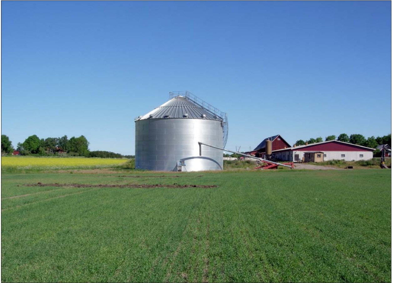
Figur 5, överst t v. Översiktsbild över utredningsområdet mot sydväst. Pålagda jordmassor i förgrunden.