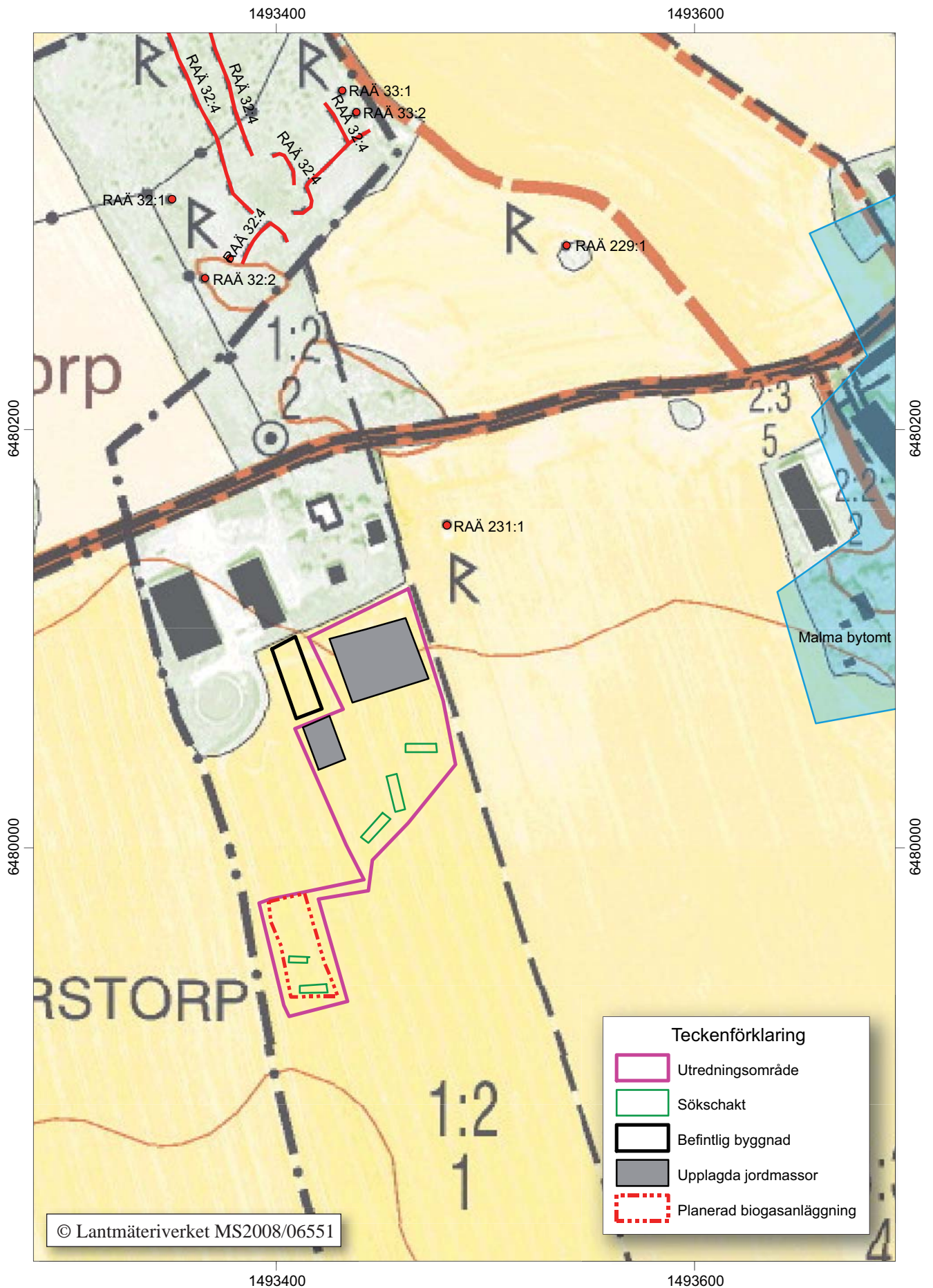
Figur 4. Utdrag ur digitala Fastighetskartan med utredningsområdet och fornlämningar markerade. Skala 1:2 500.