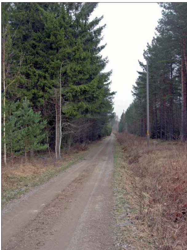
Figur 3. Vägen norrut mot Österhagen. Elkabeln plöjdes ner i vägbankens västra sida.

Jordkabeln lades ner längs den västra vägbanken från befintlig kabel vid Bagarbo i söder, via en ny transformatorstation på fastigheten Österhagen 2:2, till ytterligare en ny transformatorstation på gården