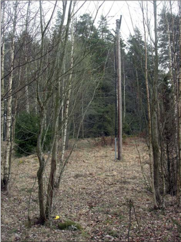
Figur 5. En av luftledningsstolparna som skulle rase-ras stod inne på gravfältet RAÄ 1. Från väster.