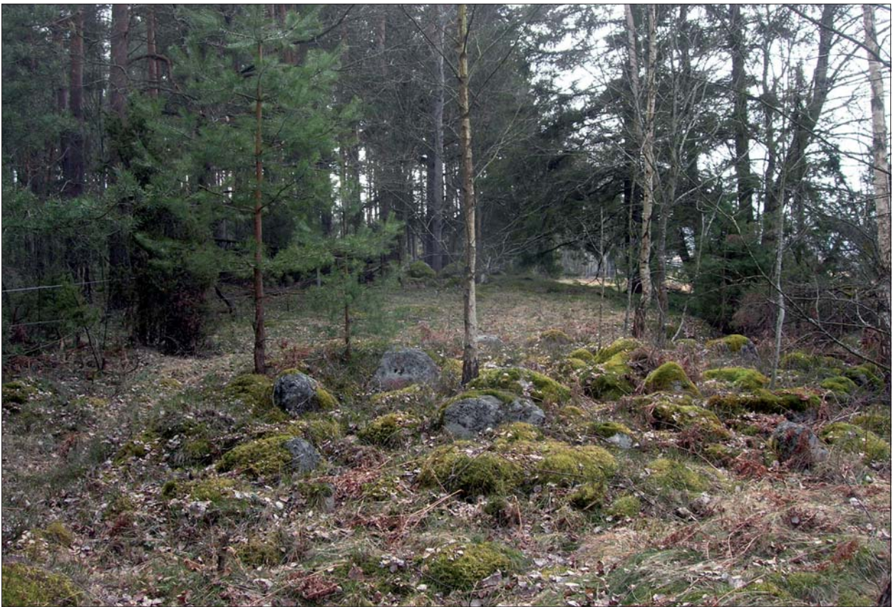
Figur 7. Graven, en kvadratisk stensättning, från norr.