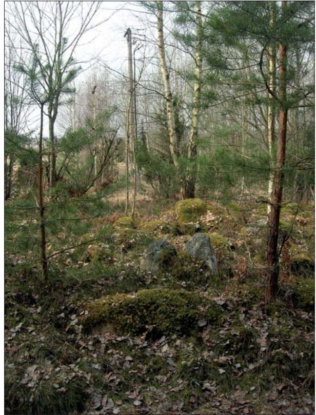
Figur 6. En av gravarna i gravfältet RAÄ 1 var belägen ca 15 m öster om luftledningsstolpen (i bakgrunden). Från öster.