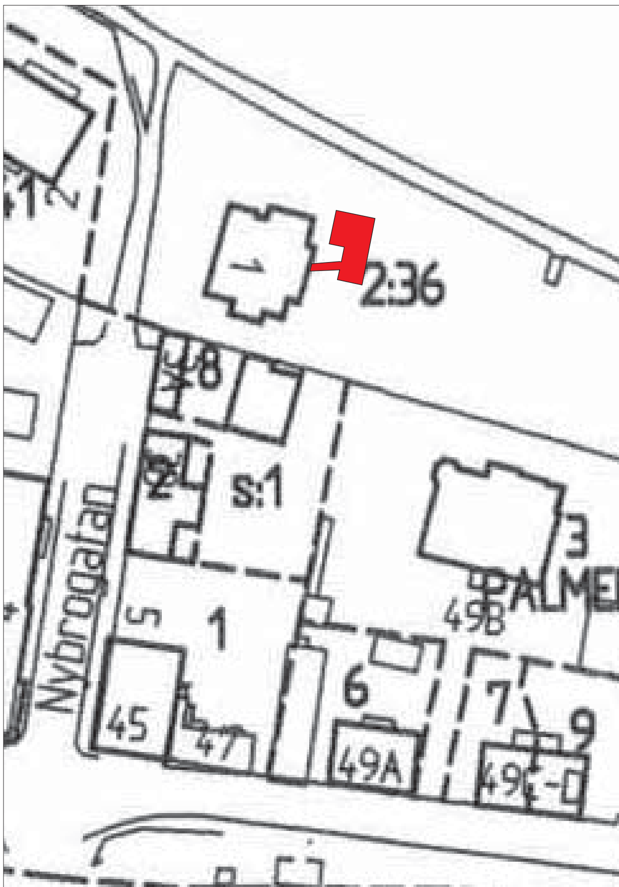
Figur 3. Utdrag ur Adresskartan, med detalj av schaktet. Skala 1:500.