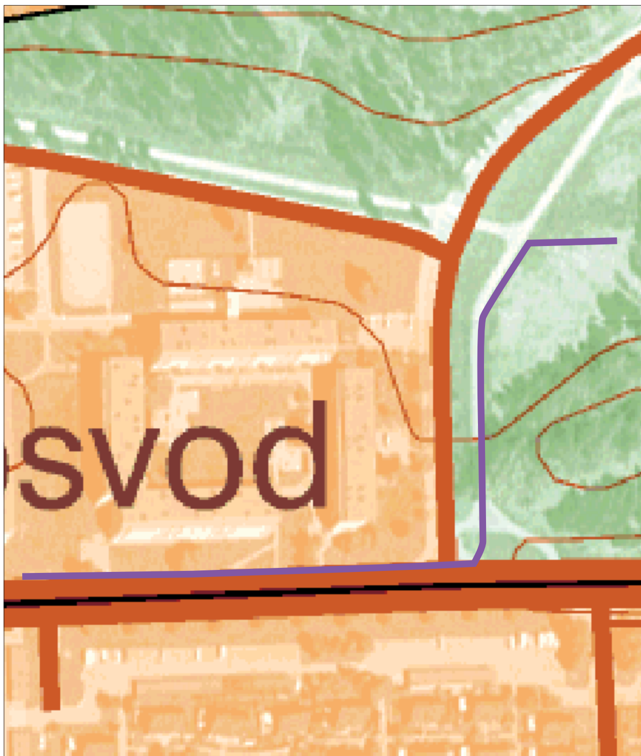
Figur 3. Utdrag ur digitala fastighetskartan med schaktsträckan markerad. Skala 1:1 000.