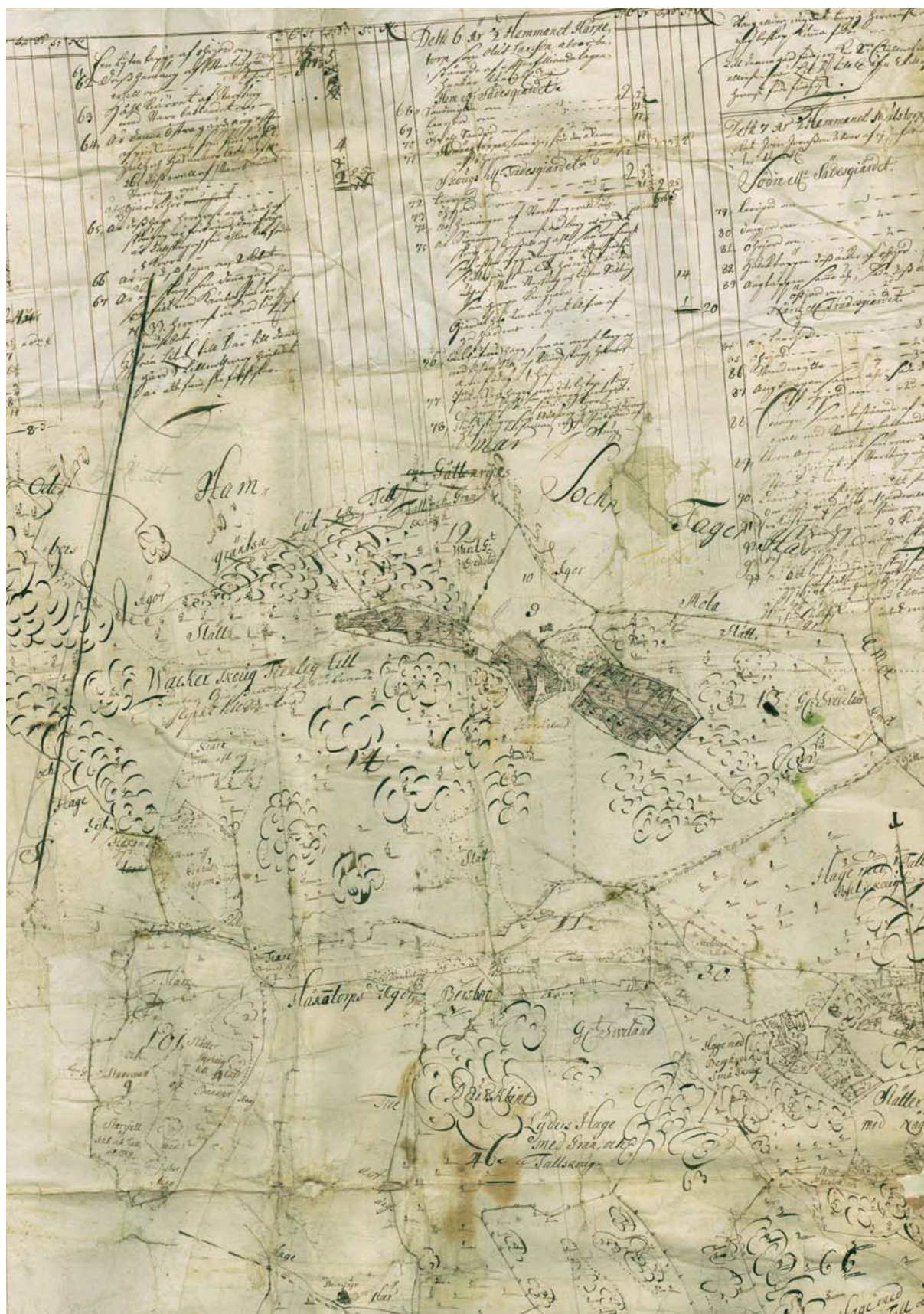
Figur 5. Utsnitt ur arealavmätningsskarta över åtta hemman i Björkekinds härad från år 1695 (Lantmäteriet i Linköping, akt 05-RÖN-7) som visar läget för Timmerdahl gård. Gården omnämns i namnformen Timberdaal i början av 1500-talet och verkar vara övergiven vid tiden för den häradsekonomiska kartan över området (1868-77). Vid inventeringstillfället kunde ett flackt 0,2 m h övermossat spismursröse iaktas i området (ÖLM 4).