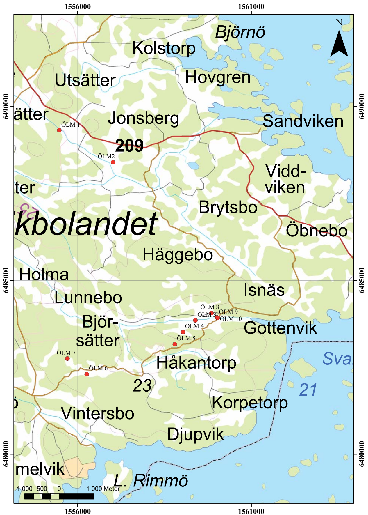
Figur 6. Utdrag ur den digitala översiktskartan med de registrerade lämningarna (ÖLM 1-10) markerade.