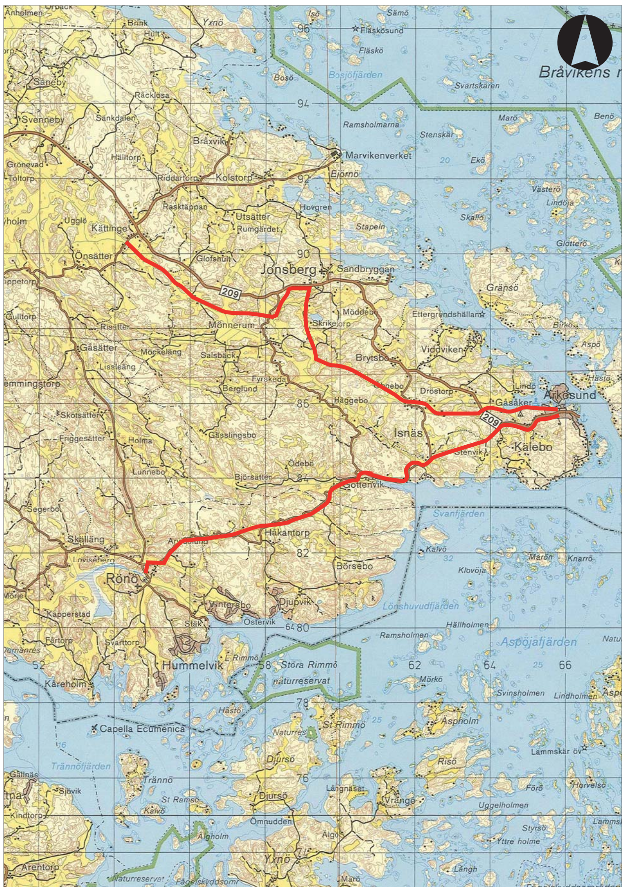
Figur 2. Utdrag ur Blå kartans blad 85 Valdemarsvik med utredningssträckorna markerade. Skala 1:100 000.