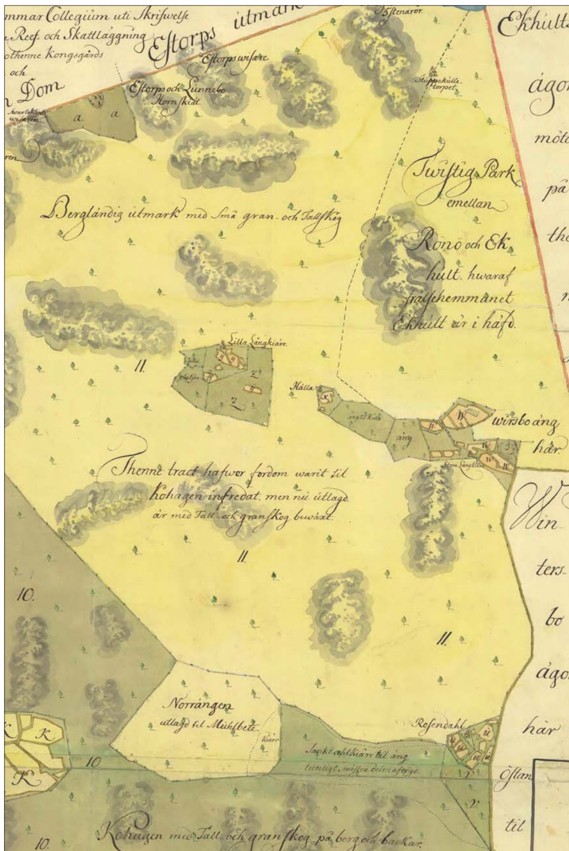
Figur 4. Utsnitt ur geometrisk avmätning över Rönö från år 1751 (LMS, akt D88-35:1) som visar de två torpen Stora och Lilla Långkiärr (ÖLM 6 och 7). Enligt lantmäteriakten är torpet Lilla Långkiärr ”sedan år 1690 upbyggt och åker upodlad...”. Vid inventeringstillfället befanns grunden efter torpet Stora Långkiärr, som inte återfinns på den häradsekonomiska kartan (1868-77) över området, vara välbevarad (ÖLM 6). Lämningsarna efter torpet Lilla Långkiärr hade utsatts för sentida täktverksamhet (ÖLM 7).