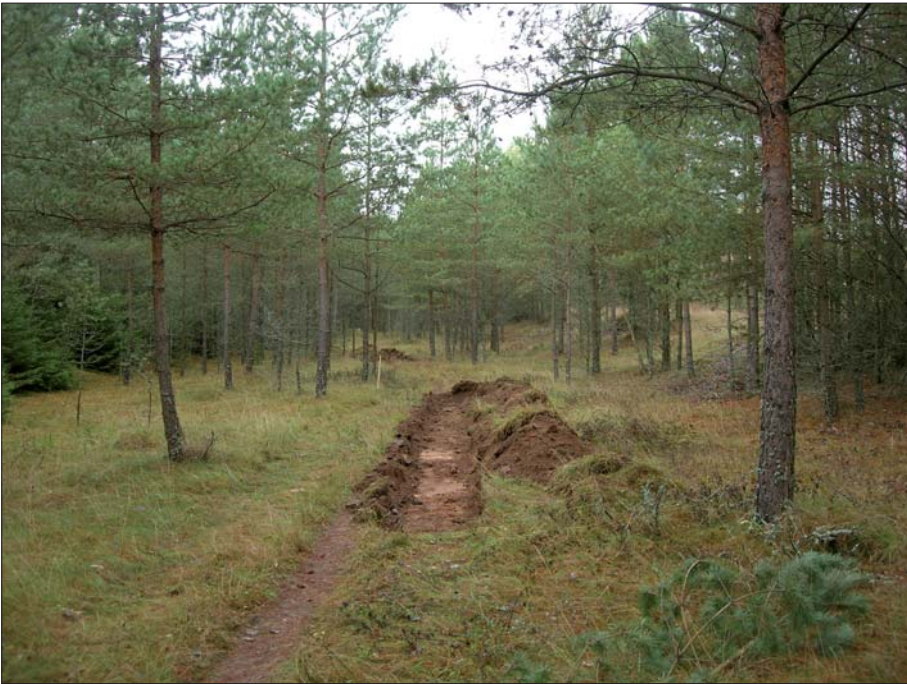
Figur 4. Söschakt i den övergivna vägsträckan.