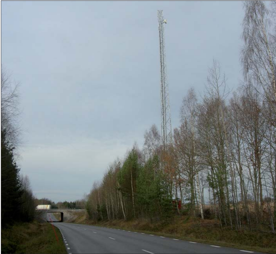
Figur 3. Västerlösavägen med 3G-masten på den östra sidan.