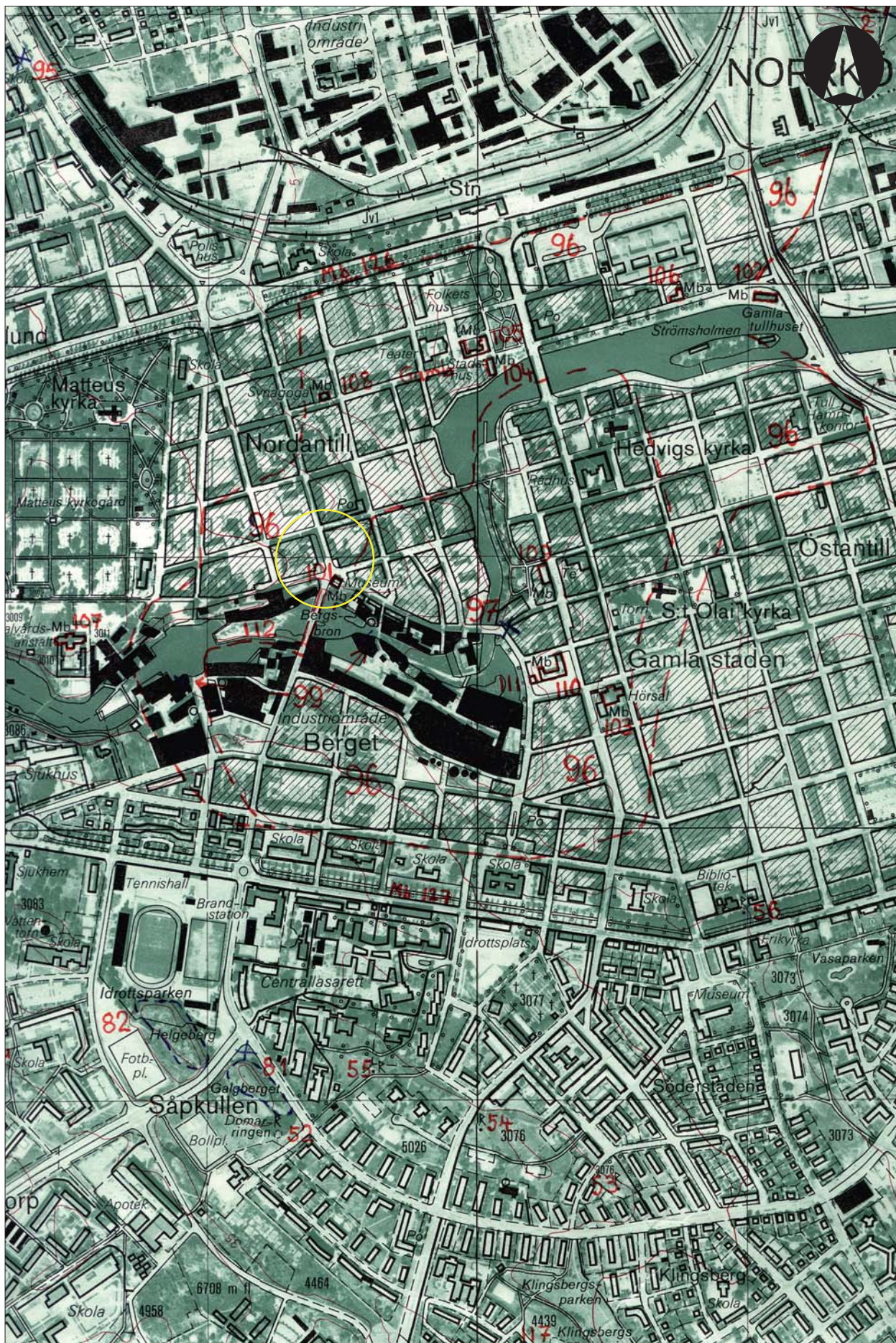
Figur 2. Utdrag ur Ekonomiska kartans blad 086 94 med undersökningsområdet markerat. Skala 1:10 000.