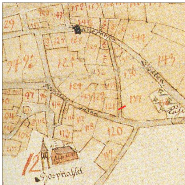
Figur 3. Utdrag ur 1696 års karta med den aktuella schaktsträckningen markerad. Skala 1:3000.

Vidare framkom rester efter en källare i gatans östra kant. Den bestod av en ca 1,4 m bred kallmurad mur med stora kantiga stenar och stenblock. På den östra sidan av murverket var en innervägg av tegel. Byggnaden bedöms som relativt sentida, sannolikt från 1800-talet. Innerväggen påträffades ca 2,1 m från befintlig byggnad i kv Delfinen. Ovan beskrivna kulturlager framkom direkt väster om källaren. Övriga delar av sträckan var störda av tidigare schaktningsarbeten.