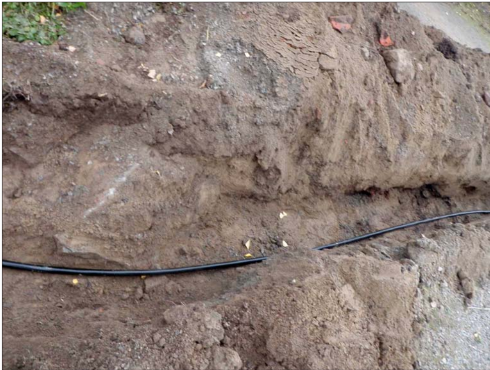
Figur 4. Bakom elkabeln syns en större sten som utgjort syllsten till en byggnad. Längre till höger på fotot syns förmodnade rester av ett golv. I dumpmassorna ingår krossat taktegel mm från äldre rivna utbus.