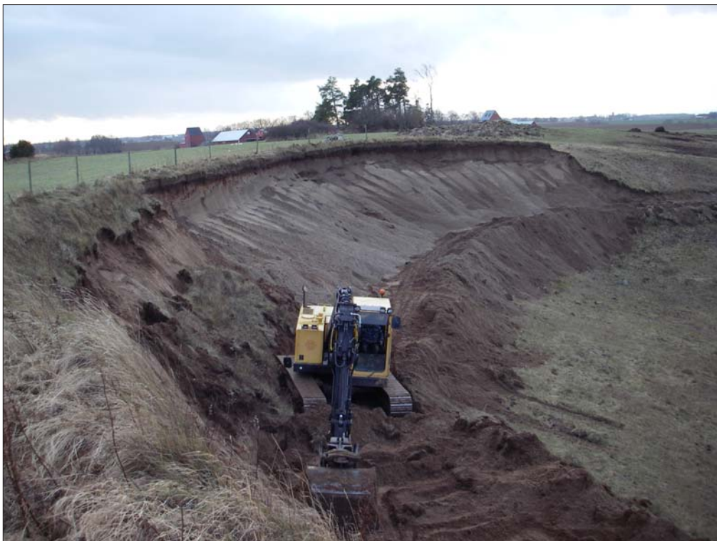
Figur 4. Översiktsfoto pågående schaktning.