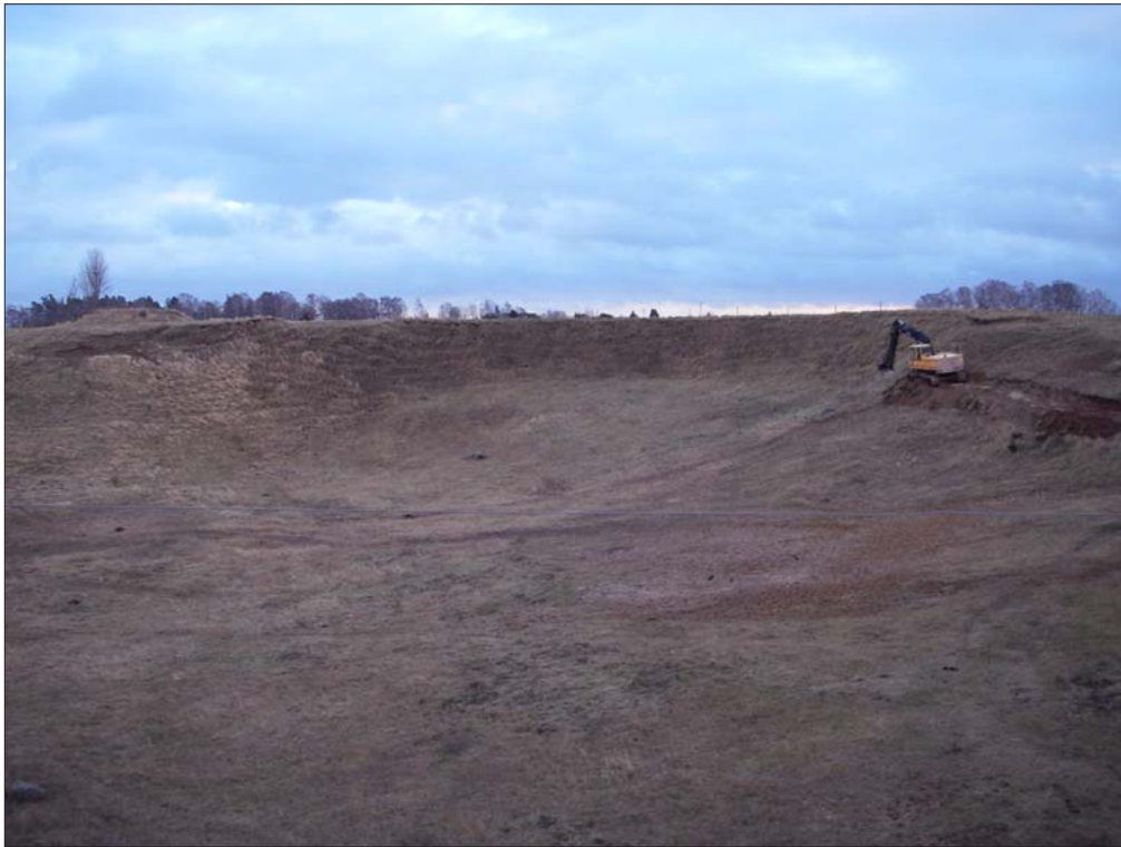
Figur 3. Översiktsfoto före schaktning.