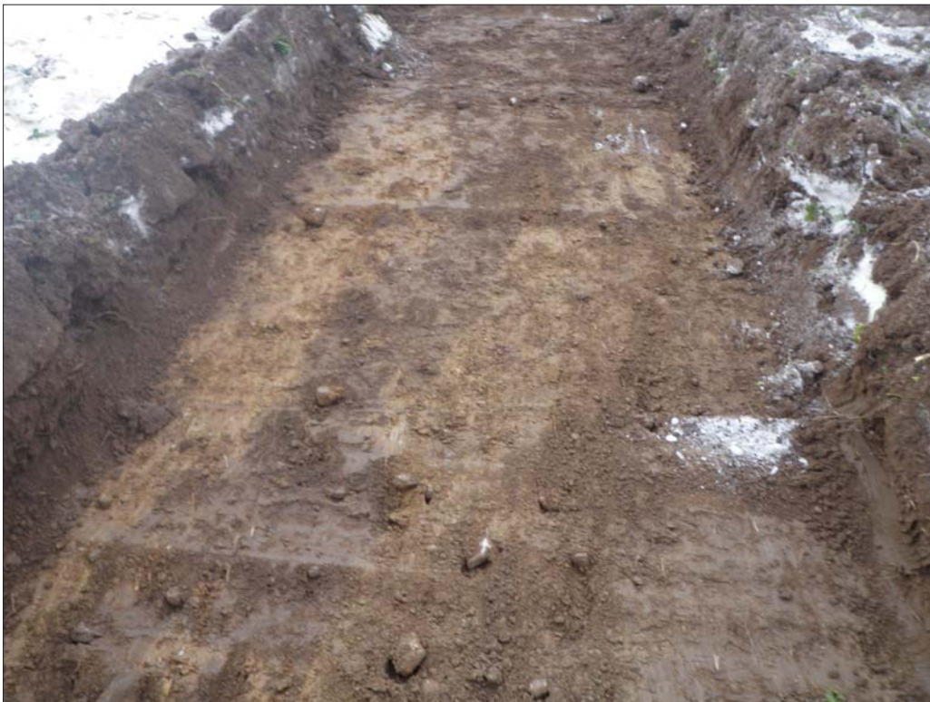
Figur 5. Spår av täckdikning, sökschakt C2 område C.