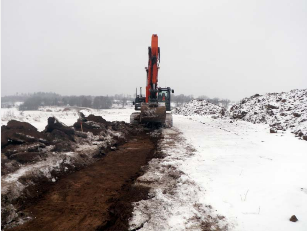
Figur 4. Sökschaktet i Område A sett mot norr. På höjden i fonden ligger S Freberga.