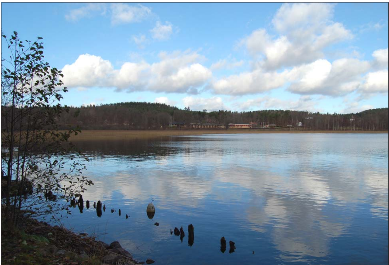
Figur 3. Vy över Yxningen från lastageplatsen med påraden i förgrunden.

Fortsatta arkeologiska åtgärder kräver beslut enligt Kulturminneslagen (SFS 1988:950). Beslut om tillstånd fattas av Kultur- och samhällsbyggnadsenheten vid Länsstyrelsen Östergötland.