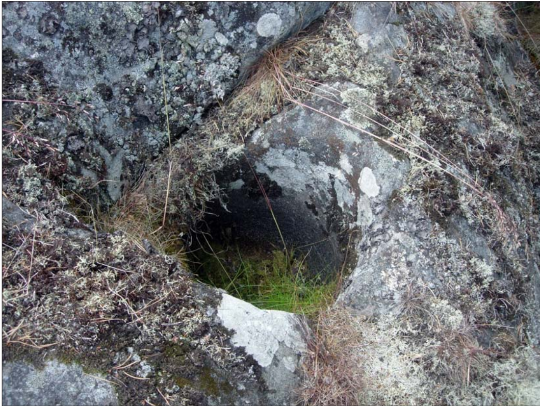
Figur 4. Jättegryta (ÖLM 1).