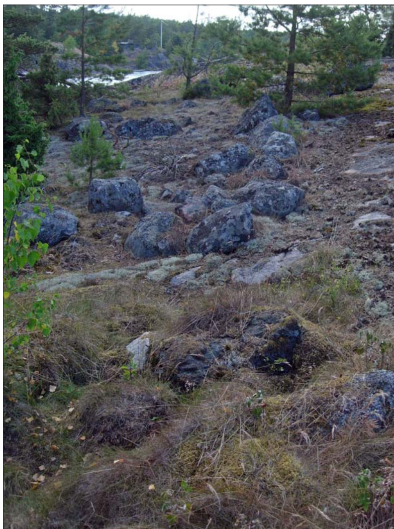
Figur 6. Stenkonstruktion (ÖLM 3).

Vid fältinventeringen påträffades även två skårar (bågformad skärm av stenar som används vid sjöfågeljakt) på Långholmen. En skåre fanns i varje ände av den avlånga ön. Då dessa inte tycks vara särskilt gamla anser inte Östergötlands länsmuseum att särskild hänsyn behöver tas i dessa fall.