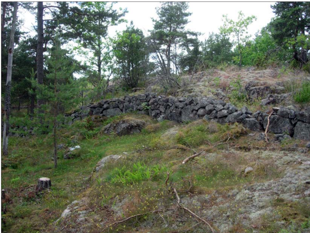
Figur 5. Stenmur (ÖLM 2).