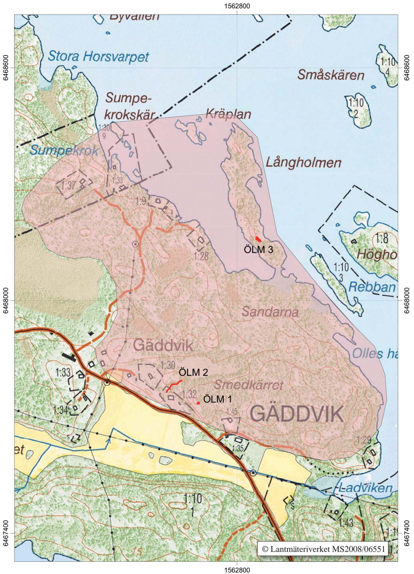
Figur 3. Utdrag ur digitala Fastighetskartan blad 8H3c Sankt Anna, med utredningsområdet och kulturlämningslokalerna utmärkta. Skala 1:6 000.