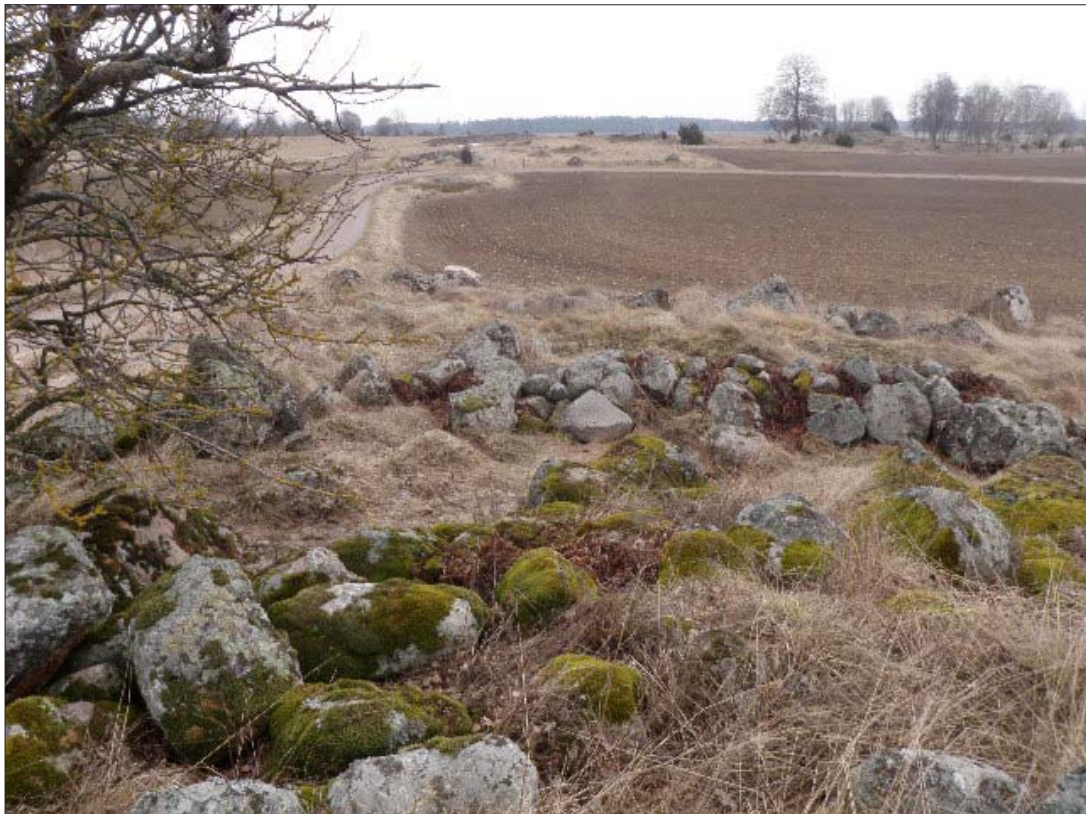
Figur 4. Igenfylld källargrop invid platsen för verk 1. Foto Olle Hörfors, ÖLM.w

Sammantaget visade utredningen att ingenting av arkeologiskt intresse finns på någon av de platser som föreslagits för placering av vindkraftverk. Inga vidare åtgärder föreslås därför heller.