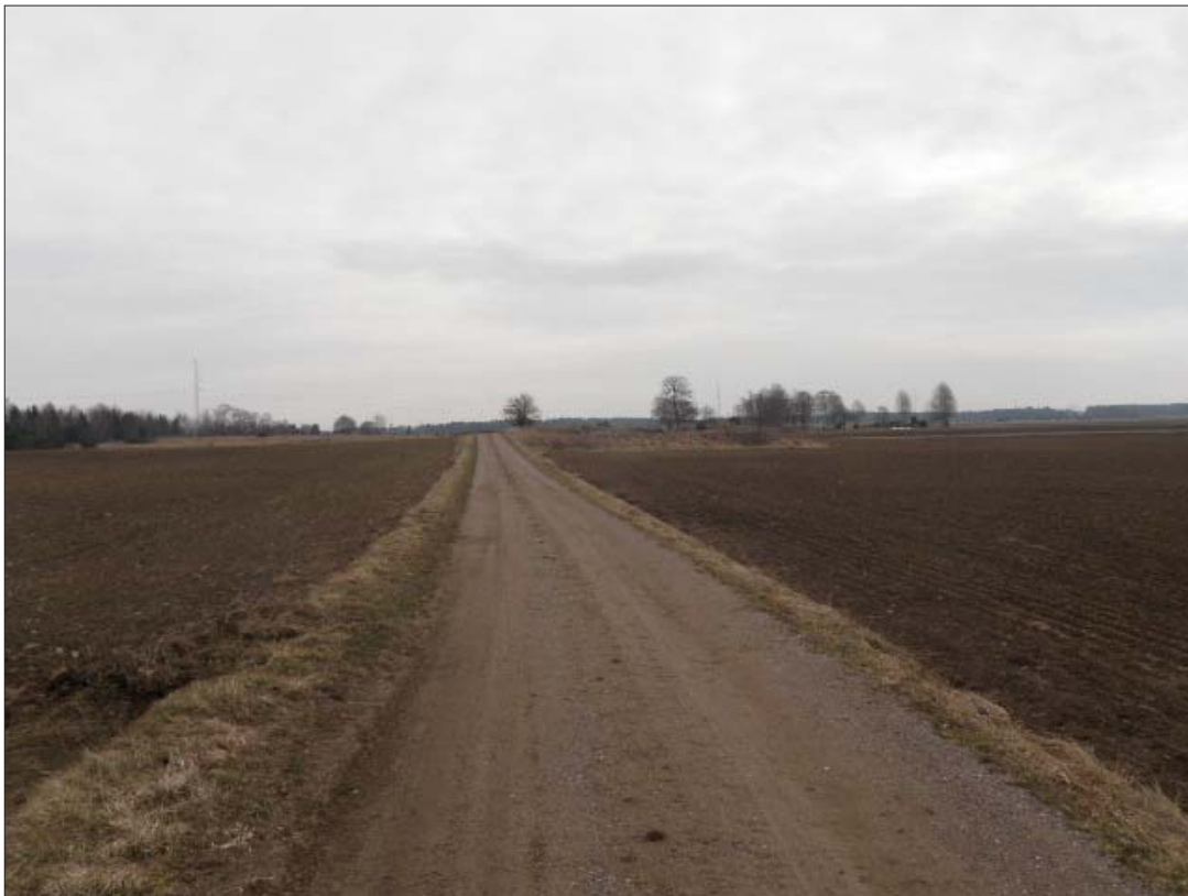
Figur 3. Landskap öster om Spärringe by sett från byn. Nedanför höjden i bakgrunden på bilden finns den tänkta placeringen av verk 1.

Platsen för vindkraftverk 1 är i åkermark nästan direkt söder om ett mindre impediment invid en brukningsväg. Norr om vägen finns högre liggande åkermark och impediment med registrerade fornlämningar i form av stensättningar (RAÄ 23 och 24),