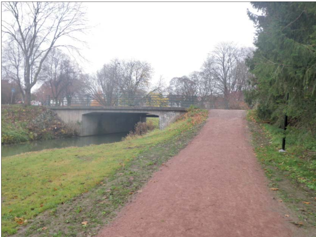
Figur 5. Undersökningsområdet sett mot norr. Schaktet löpte i den grusade gångvägen och profilen ritades på östra sidan bort från ån. Schaktbotten höll samma nivå varför schaktet blev betydligt djupare då bron passerades.