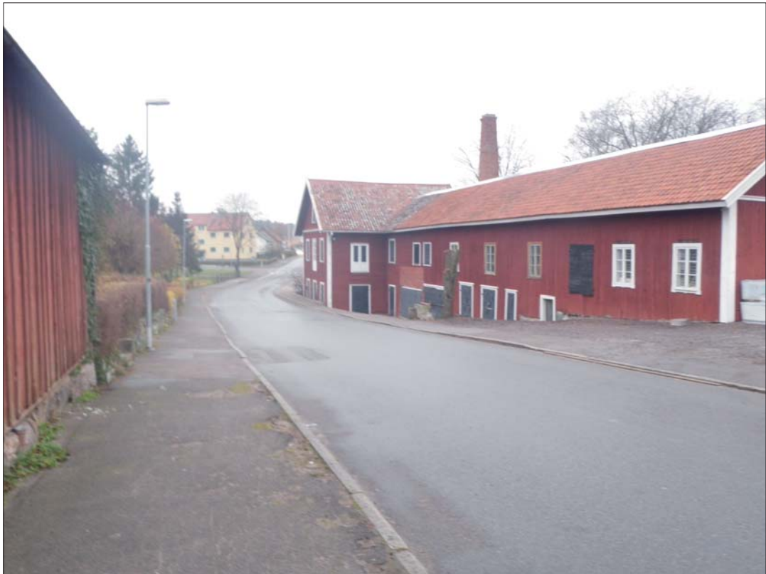
Figur 4. Borggatan sedd mot väster. I kvarteret Folkungen ligger en äldre rödmyllad fabriksbyggnad längs med Borggatan.