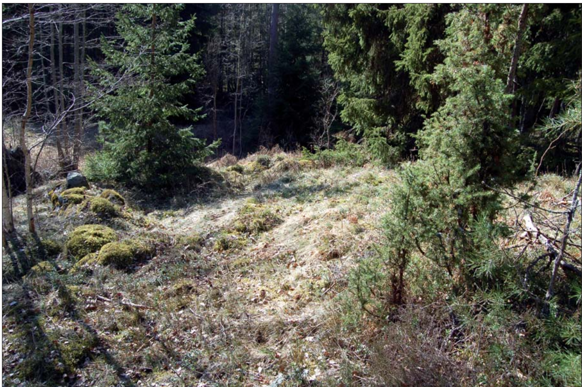
Figur 6. Torplämningen ÖLM 9 i form av en husgrund med spismursröse, från NÖ. Delar av syllstensgrunden kan ses i bildens vänstra och mellersta del. Torpet har ej kunnat identifieras på kartmaterial men grunden av natursten ger ett ålderdomligt intryck. I mantalslängden över Rönö socken från år 1707 nämns en fördubblingsbåtsman Erik Vipunge under Börsebo. Husgrunden bör härröra från detta båtsmanstorp.