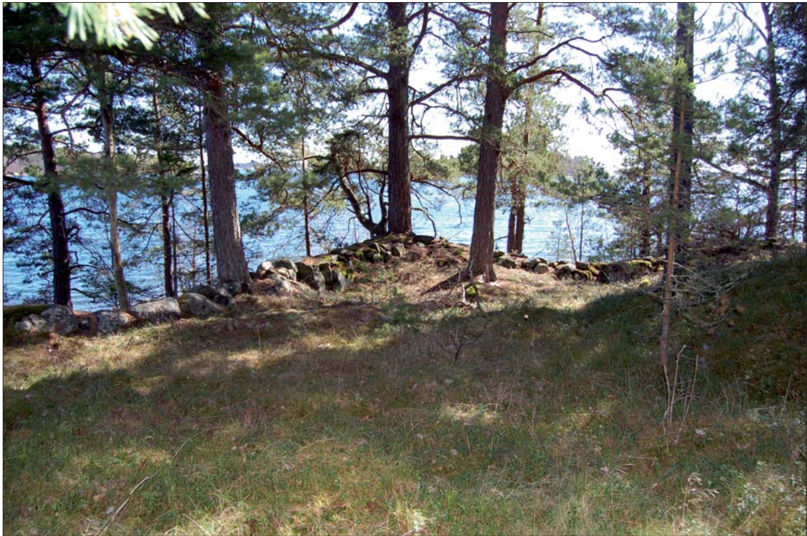
Figur 5. Del av skyttevärnnet ÖLM 5, från NV. Liknande skyttevärn löper utefter delar av utredningsområdets kuststräcka och är anlagda på platser med god sikt ut mot havet.