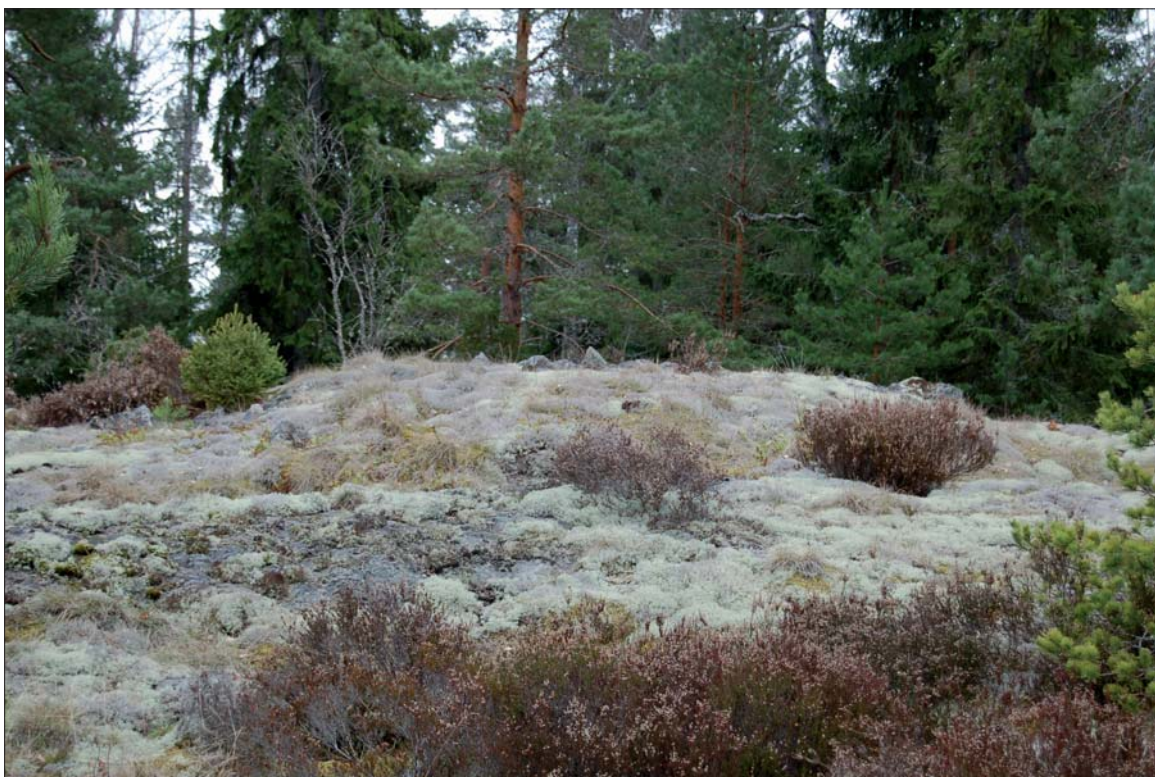
Figur 4. Stensättning RAÄ 8:2, från V.

N om Svanviken påträffades lämningar efter kolning i form av en kolbotten och ett område med kolbotten och kolarkoja (ÖLM 8 och 10). I samma område påträffades även en husgrund som ger ett ålderdomligt intryck (se fig 6), bestående av en syllstensgrund av naturstenar med ett närmast kvadra-