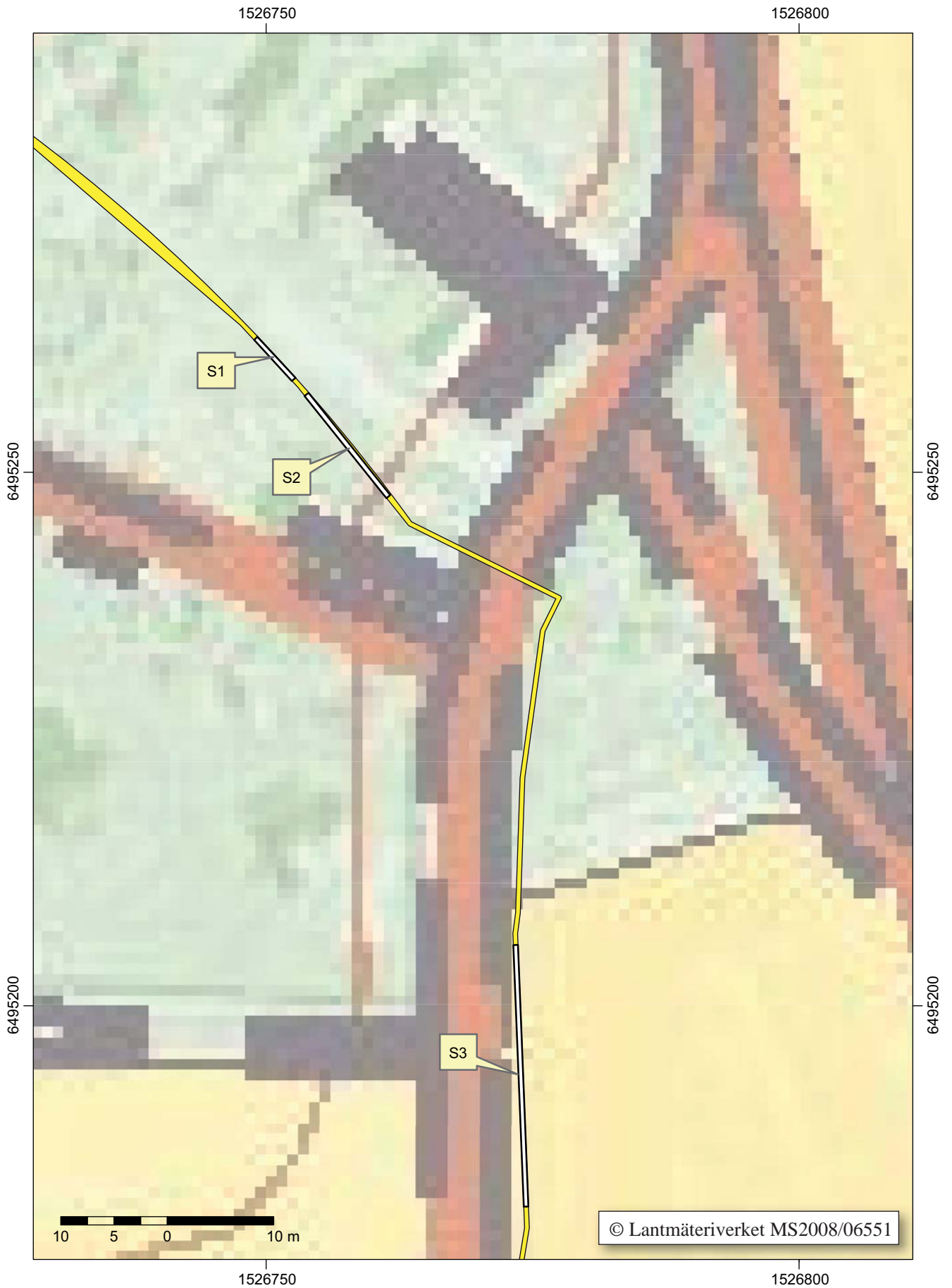
Fig 3. Utdrag ur digitala Fastighetskartan med de tre söschakten markerade. Ledningssträckan är markerad som en gul och svart linje. Skala 1:500.