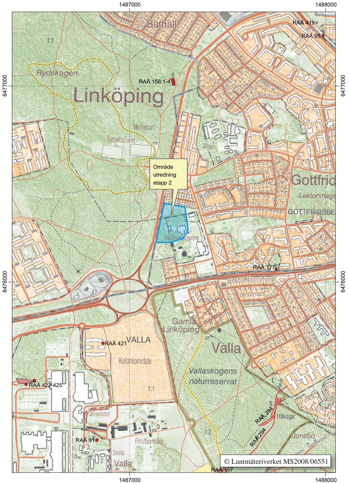
Figur 2. Utdrag ur digitala Fastighetskartan med området för den arkeologiska utredningen etapp 2 markerat. Skala 1:10 000.