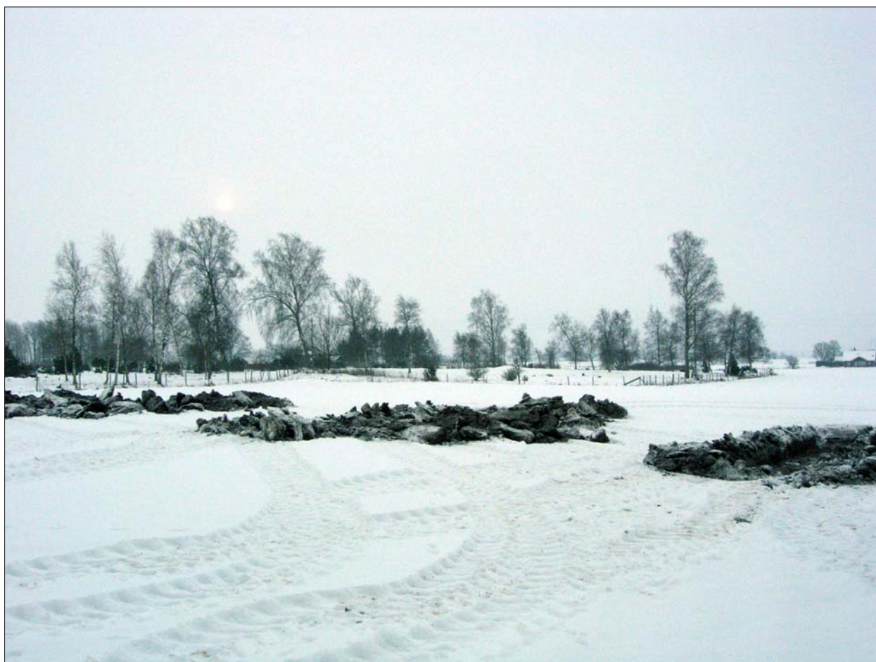
Figur 3. Inom fastigheten öppnades flera sökschakt. Såväl undersökningsområdet som fornlämningarna i hagmarken (i bakgrunden) ligger på en flack höjd.