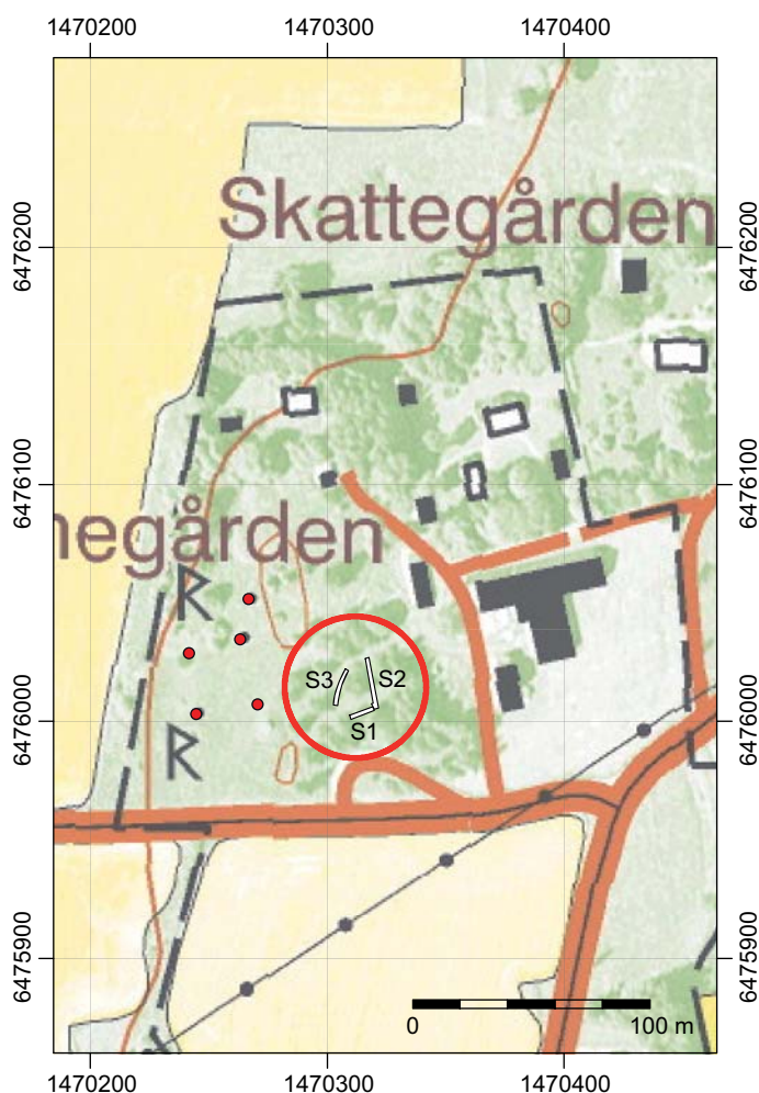
Figur 3. Den aktuella ytan för tänkt nybyggnation med sökschakt (S1-S3) och närliggande fornlämningar markerade.

Syftet med den arkeologiska förundersökningen var primärt att fastställa huruvida fast fornlämning skulle komma att beröras av det planerade arbetsföretaget. Ifall fast fornlämning av mindre omfattning påträffades skulle denna dokumenteras avseende karaktär och omfattning samt om möjligt dateras. Om lämningarna