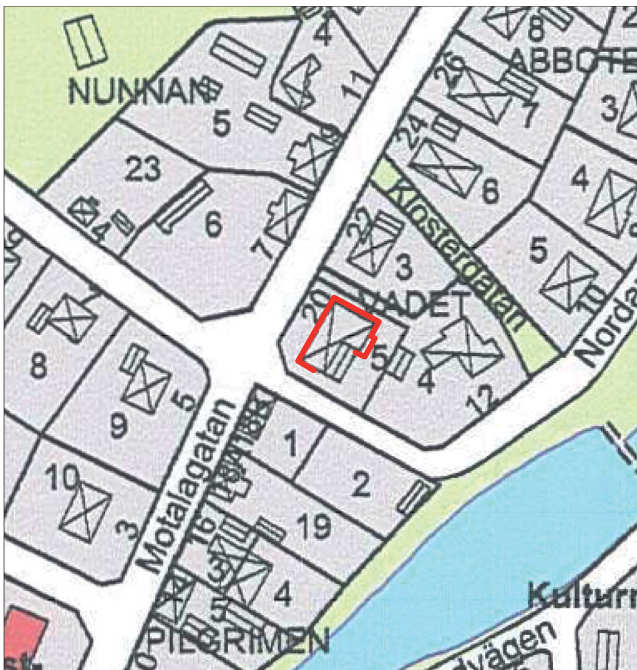
Figur 3. Utdrag ur stadskarta över Skänninge med dräneringsschaktet markerat.

Skänninge är beläget centralt i ett öppet jordbrukslandskap. Staden tycks ha vuxit fram successivt under 1000- och 1100-talen och omnämns första gången år 1178. Staden nådde sin höjdpunkt under senare delen av 1200-talet och 1300-talet. 1400-talet innebar en stark tillbakagång och under 1500-talet verkar Skänninge snarast haft karaktären av en förstorad bondby. Generellt är kulturlagren i Skänninge diffusa och svåra att datera. Brandlager från de stora stadsbränderna kan bara spåras fläckvis i staden. Sannolikt har bebyggelsen varit gles i förhållande till många andra