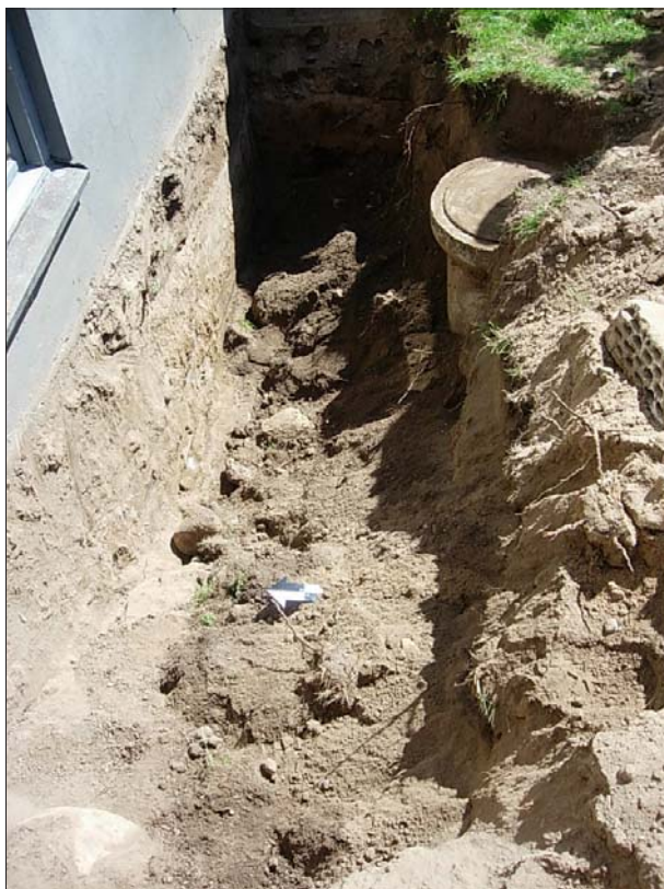
Figur 4. Frischaktet.

År 2000 utfördes en arkeologisk undersökning i samband med nedläggandet av fjärrvärmeledningar i Nordanågatan, Motalagatan, Nunnestigen och S:t Martins väg. Längs sträckningen förbi Motalagatan 24 och 26 påträffades ett antal skärvor svartgods av äldre typ som visar på aktivitet från tidig medeltid och vid Motalagatan 28 fanns lämningar från högmedeltiden i form av C1-gods (Björkhager i manus).