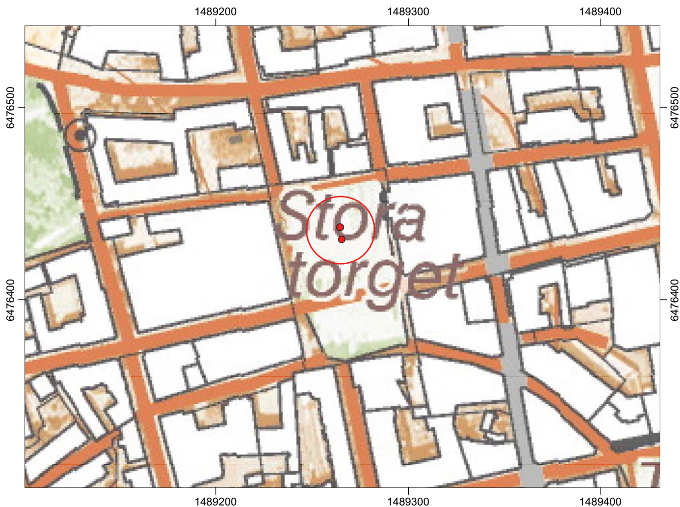
Figur 3. Utdrag ur den digitala Ekonomiska kartans blad 8F5h med platsen för schakten markerade. Skala 1:2 000.

Ett flertal undersökningar har tidigare utförts på Stora Torget och i de kringliggande kvarteren. 1980 gjordes en större utgrävning längs torgets västra och östra sida. I den senare framkom lämningar efter det rådhus som förstördes vid stadsbranden år 1700. I schaktet på torgets västra sida framkom främst lämningar från den tidigaste generationen av vägar på platsen samt djurhågnader och en torgbod (Gustin 2007). 1999 grävdes 19 mindre schakt runt om på Stora Torget (Ternström 2003). Huvuddelen av dessa schakt berörde inte marken djupare än 0,4 m. Lagren som påträffades bestod till störst del av omrörda kulturlager. Tidigare har det grävts för markisfundament på Stora Torget. 2005 och 2007 schaktades det för totalt fyra fundament i den norra delen av torget (Wennerlund 2005, Gustin 2007). Under de påförda massorna, som varierade mellan 0,3-0,5 m, påträffades ett antal kulturlagerskiktningar som alla dock var fyndfattiga.