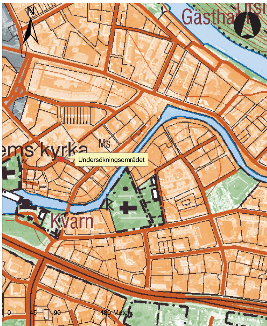
Figur 2. Utdrag ur Fastighetskartan med undersökningsområdet markerat. Skala 1:5 000.

vakning av schaktningen för de två stolpfundamenten och de anslutande ledningarna. Ingreppet utfördes av E. on Elnät AB/ ElektroSandberg AB på uppdrag av Söderköpings kommun. Ansvarig för den antikvariska kontrollen var Christer Carlsson vid Östergötlands länsmuseum.