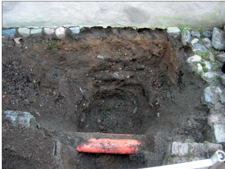
Figur 4. Schaktet i Hospitalsgatan.