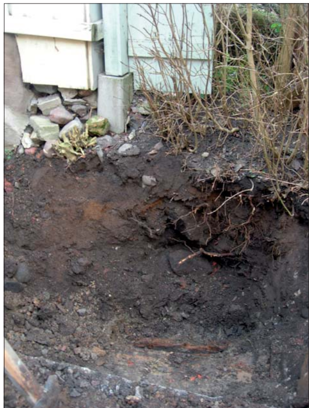
Figur 5. Schaktet i Linköpingsgatan.

Tagesson G & Ullgren K. 1993. Kv. Munken 1, Söderköpings stad och kommun, RAÄ 14, Östergötland . Antikvarisk kontroll. Östergötlands länsmuseum. Linköping.