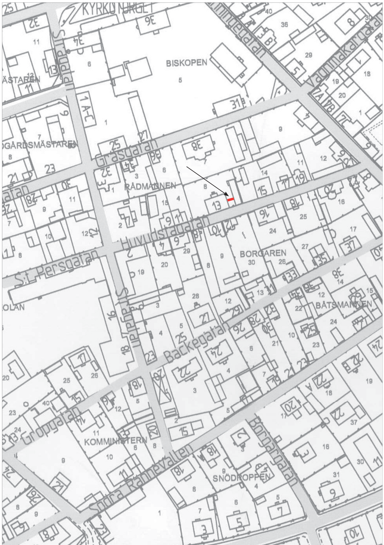
Figur 3. Utsnitt ur Adresskartan över Vadstena med schaktet markerat (rött). Skala 1:1 500.