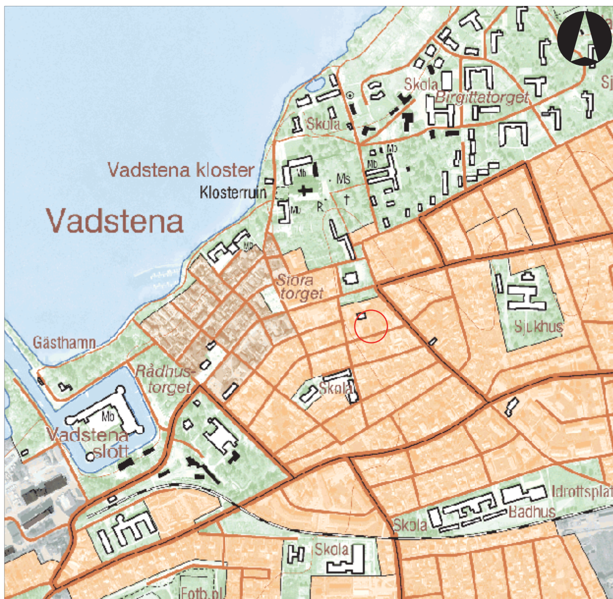
Figur 2. Utdrag ur digitala Fastighetskartan med undersökningsområdet markerat. Skala 1:5 000.