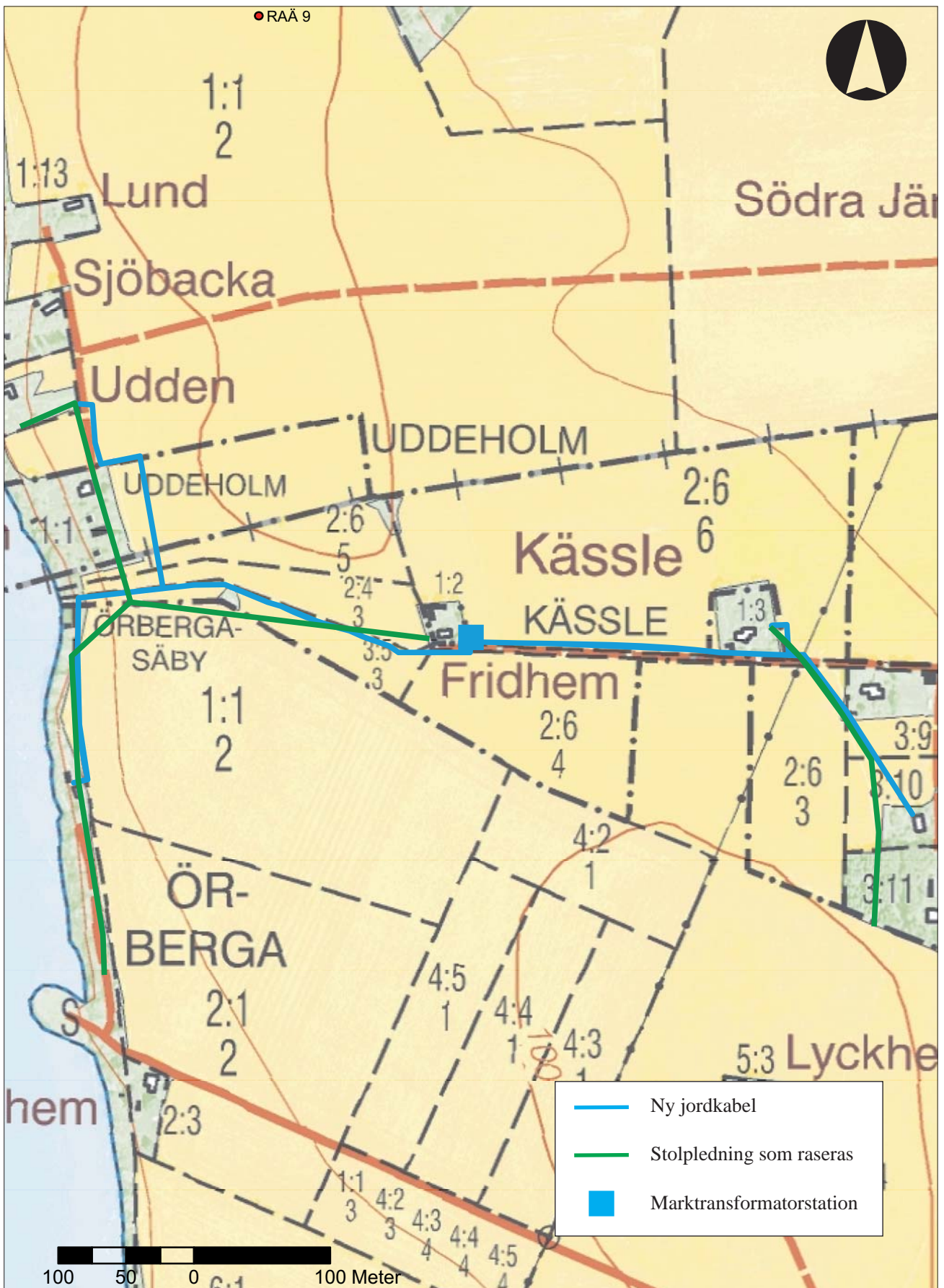
Figur 2. Utdrag ur digitala Fastighetskartan med utredningsområdet markerat. Skala 1:4 000.