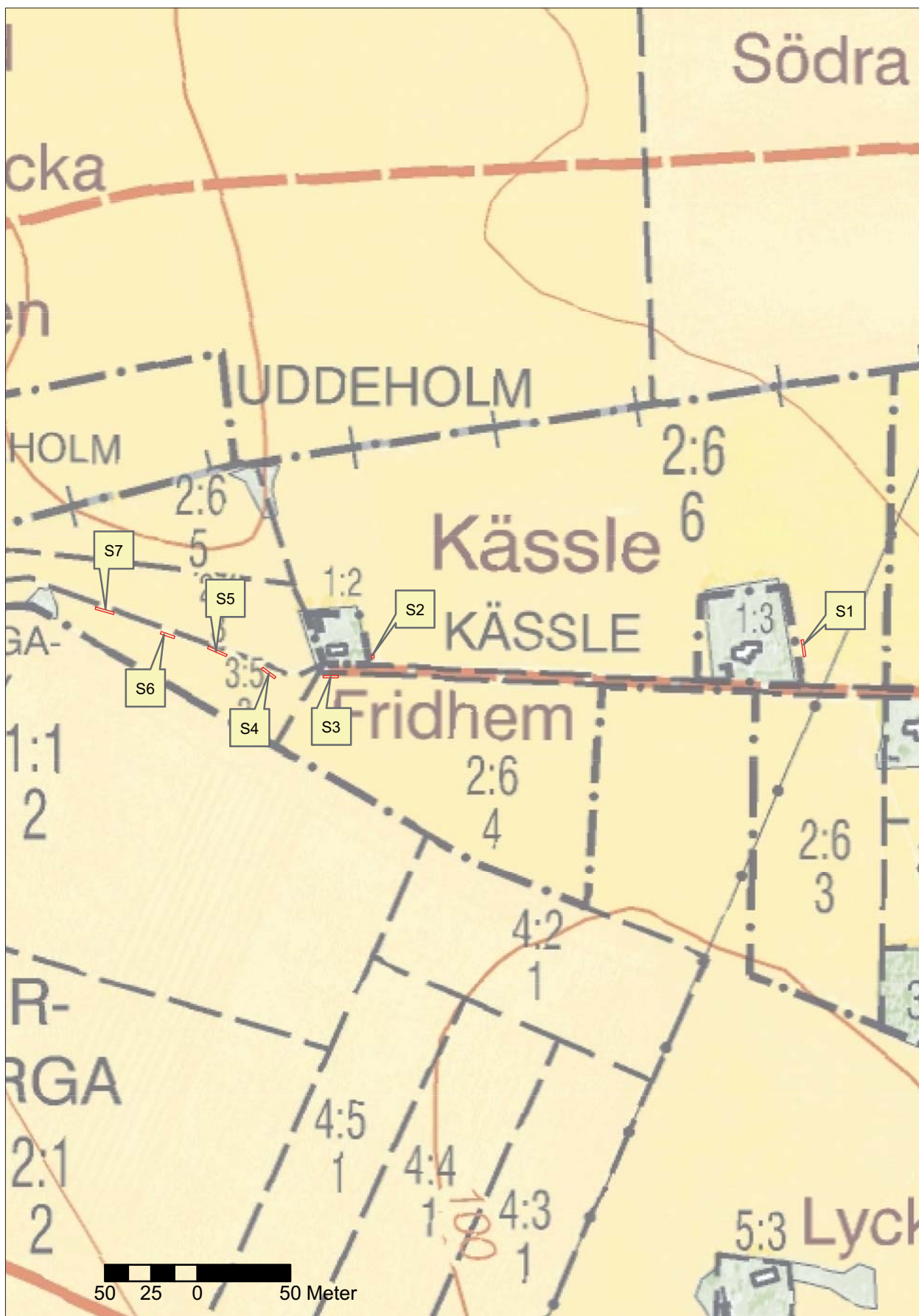
Figur 3. Utdrag ur digitala Fastighetskartan schakten utmärkta. Skala 1:3 000.