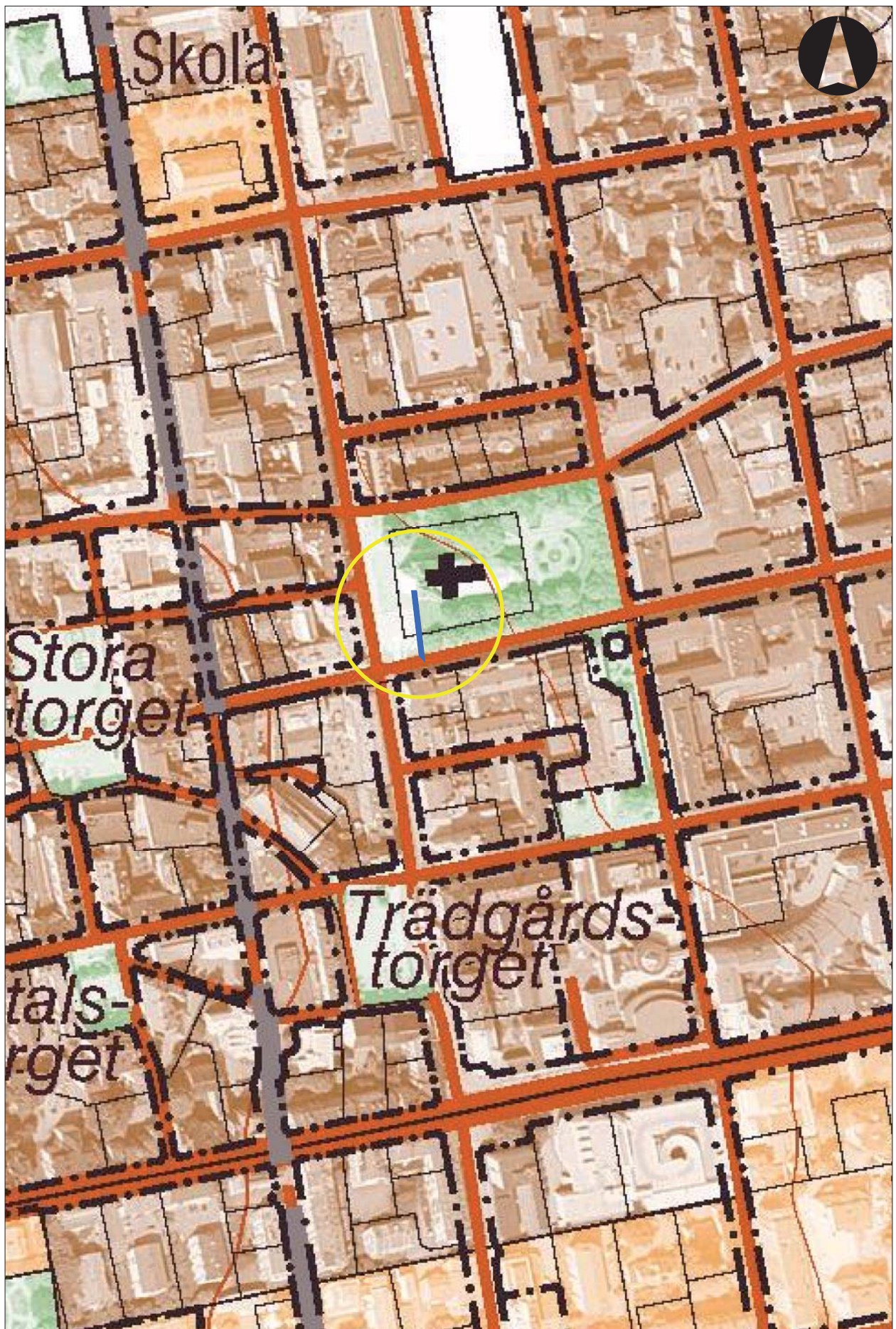
Figur 2. Utdrag ur Stadskartan över Linköping med undersökningsområdet markerat. Skala 1:10 000.