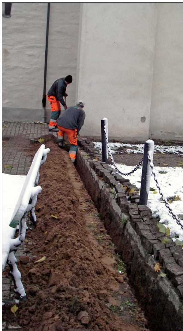
Figur 3. Handschaktning för ny telekabel till S:t Larskyrkan.

Endast sättsand för cementplattor och kantsten berördes. På 0,3 m djup framkom ställvis ytan på ett sotigt lerlager. Detta kom dock inte att beröras av schaktningen varför det inte undersöktes närmare. Utifrån resultaten av den antikvariska kontrollen bedömdes att ledningen kunde förläggas enligt planerna utan ytterligare arkeologiska insatser.