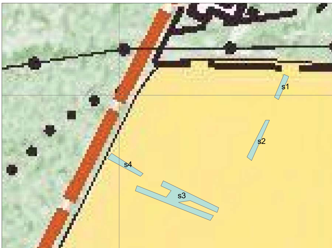
Figur 3. Schakt inom utredningsytan. Skala 1:1 000.

Ett steg bestod av besiktning i fält samt kart- och arkivstudier. Utredningens andra steg utfördes i form av en sökschaktsgrävning. Större delen av det aktuella området var vid utredningstillfället urschaktat och uppfyllt med sten. Det område som var urschaktat och uppfyllt vid utredningstillfället bedömdes vara så skadat att några arkeologiska åtgärder inte var motiverade. Sökschakten öppnades istället inom de delar av utredningsområdet som inte var sedan tidigare skadade av markarbeten. Dokumentationen bestod av inmätning med DGPS och beskrivning.