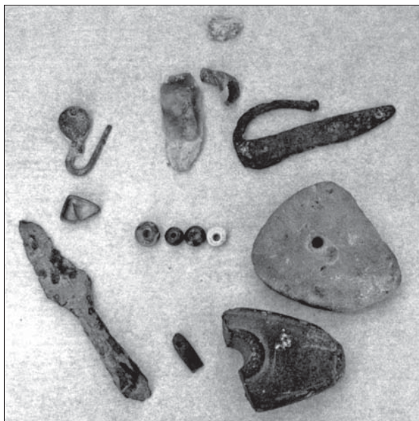
Figur 4: Förhistoriska föremål funna vid jordbruksarbete. Förvaras nu i gårdsmuseet, Klovstens gård, Vikingstads socken. Den största delen av föremålen finns även registrerade som lösfynd (RAÄ 173).

Knackstenarna och flintskrapan tillsammans med skafthålsyxan och hängsmycket bör dateras till neolitikum; skafthålsyxan antyder även senneolitikum/äldre bronsålder. Gravfält med ovan nämnda typer av stensättningar på de östgötska centralbygderna kan i generella termer dateras till den äldre järn-åldern, ibland även med gravläggningar från den yngre bronsåldern. Skärvestensförekomster av det slag som finns på gravfältet RAÄ 184, brukar dateras till denna äldre period.