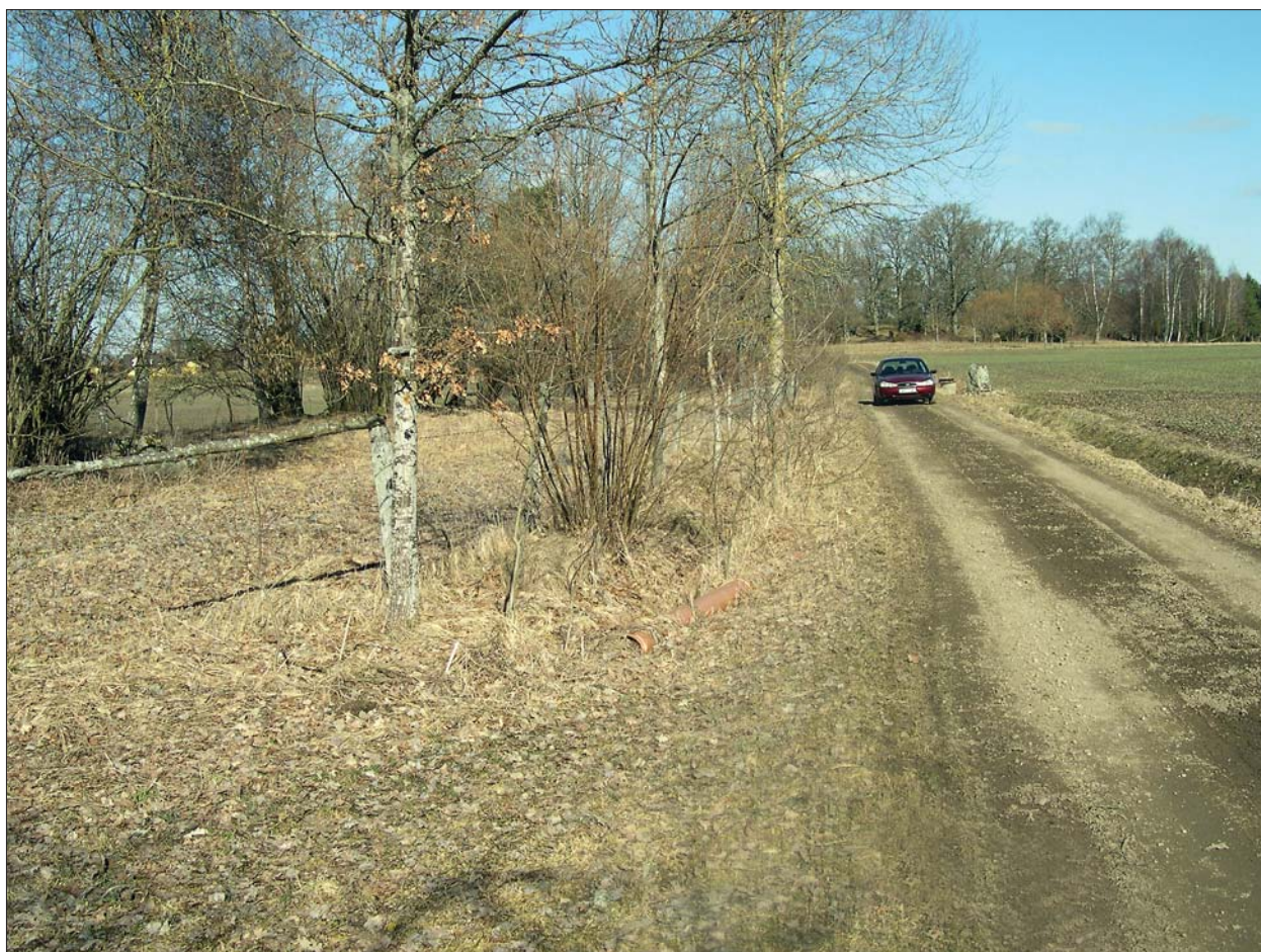
Figur 3. Översiktsbild, delsträcka 1.

Arbetsområdet ligger i en fornlämningsrik bygd. I kabelsträckningens närområde finns ett flertal fornlämningar: ca 100 m norr om kabelns slutpunkt intill Vikingstad-Klovsten är ett gravfält (RAÄ 98) beläget, bestående av elva runda stensättningar. I fornlämningen ingår också platsen för det s k "Lilla Hargsfyndet", vilket innehåller ett bronskärl, en sköldbuckla av järn, belagd med förgyllt silverbleck med ornament och infattade karneoler, ett tveeggat järnsvärd, ett sköldhandtag av järn, en doppsko av järn till svärdsslida, bronsbeslag m m (Fornvännen 1911:260f). Fyndet påträffades i ett grustag i början på 1900-talet och torde vara en brandgrav, med bronskärlet som gravurna. Dateringen ligger i tidig yngre romersk järnålder. Fornlämningen RAÄ 98 inbegriper även oregelbundna förhöjningar samt gropar som har tolkats som möjliga bebyggelse lämningar.